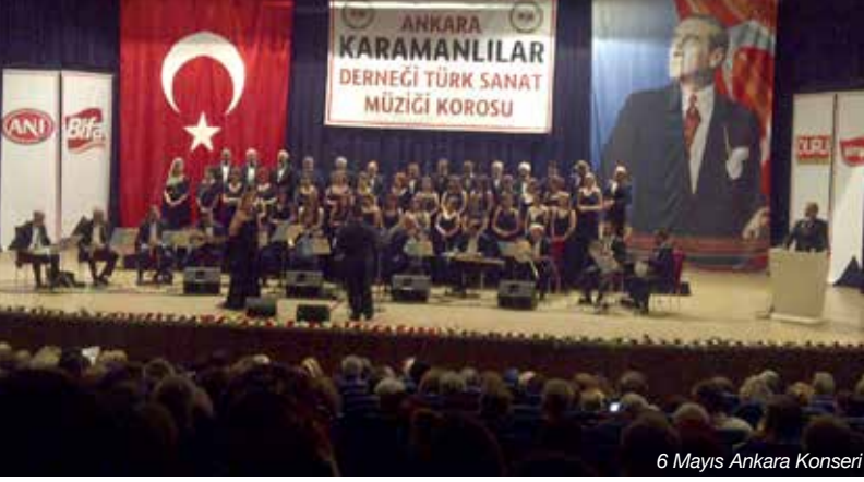
6 Mayıs Ankara Konseri